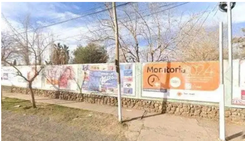
Kiosco de diarios y revistas don usted como llegar